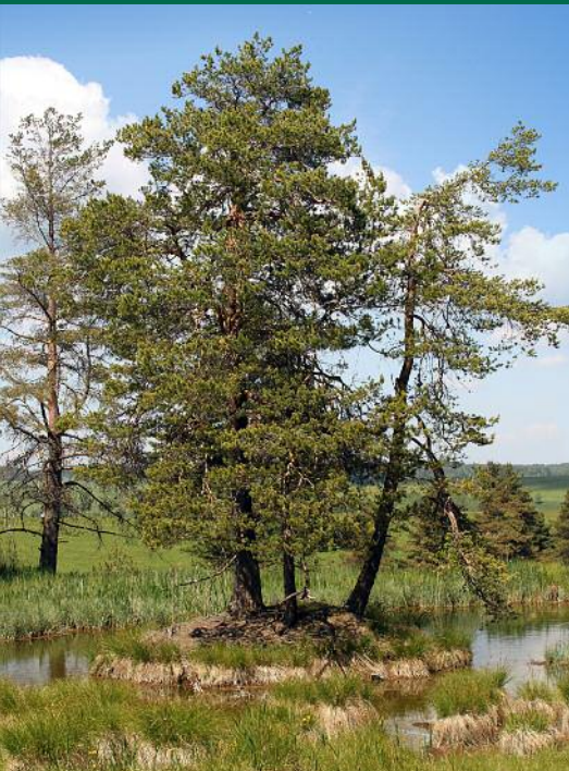
Přírodní rezervace Mokřady pod Vlčkem

Tajemná krajina kaňonovitých údolí, s ostrohy dávných tvrží a hradů strážících solnou stezku, krajina poznamenaná těžbou a pohnutými lidskými osudy.