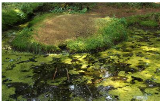
Mofetové jezírko v přírodní rezervaci Smradoch