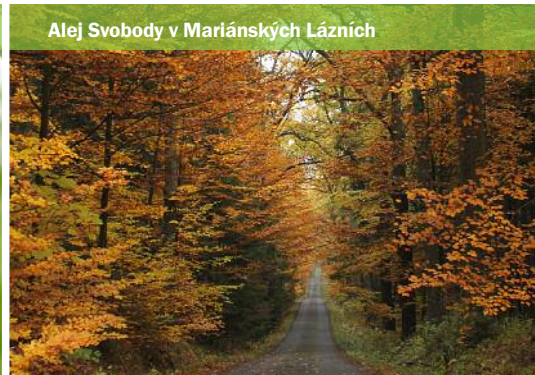
Alej Svobody v Mariánských Lázních

Mezi nejceněnější místa Slavkovského lesa patří mozaika mokřadních luk a slatinišť na Tepelsku. Nikdy se tu nedalo intenzivně hospodařit a dodnes se proto zachovala pozoruhodná společenstva rostlin a bezobratlých živočichů. S koncem jara na loukách vykvétá kosatec sibiřský, prstnatec májový, vachta trojlístá či upolín nejvyšší. Čertkus luční hostí jako jediná živná rostlina housenky vzácného hnědáška chrastavcového. Vymyslet vhodné hospodaření na místech, kde se vyskytují chráněné druhy rostlin i motýlů, je ochranařským oříškem. Zatímco většinu rostlin prospívá kosení luk ve vrcholném létě, hnědásek má v této době době nakladená vajíčka a vylíhlé housenky, které by kosení luk zničilo. Proto se čertkusové louky kosí po částech koncem jara tzv. mozaikovou sečí.